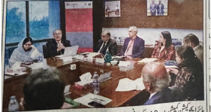
ہائر ایجوکیشن کمیشن اور 16 پاکستانی جامعات کے تعاون سے مکالمے کا انعقاد کیا جا رہا ہے