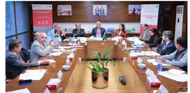
Participants attend a dialogue organised by USAID's Higher Education System Strengthening Activity (HESSA) in this image released on August 16, 2024.

Islamabad: The United States Agency for International Development (USAID), through its Higher Education System Strengthening