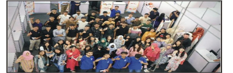
.....کراچی IBA میں نئے آنے والے اسٹوڈنٹس کے اعزاز میں ینٹیشن گالا کے موقع پر لی گئی تصویر.....