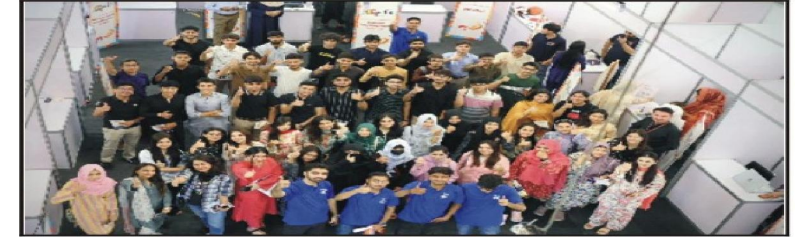
.....کراچی: IBA میں نئے آنے والے اسٹوڈنٹس کے اعزاز میں ینٹیشن گالا کے موقع پر لی گئی تصویر.....