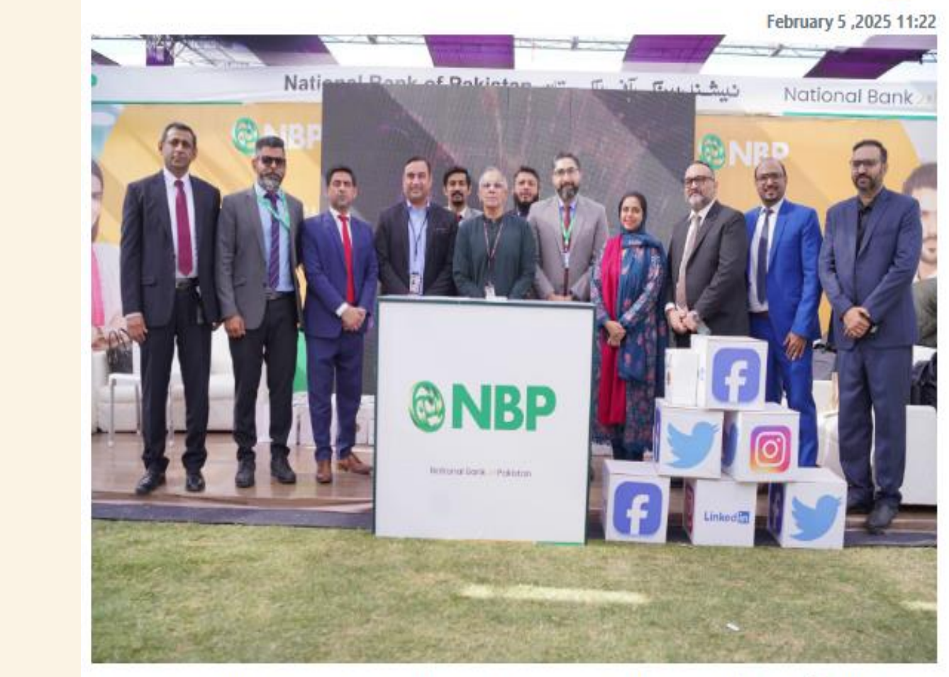
کراچی انسٹیٹیوٹ آف بزنس ایڈمنسٹریشن (IBA) کراچی نے اپنے مین کیمپس میں سالانہ کیریئر فیئر 2025 کا شاندار انعقاد کیا۔ یہ ایونٹ IBA کیریئر ڈویلپمنٹ سینٹر (IBA-CDC)کے زیر اہتمام منعقد ہوا۔ اس سال کا تھیم "تھنک نیکسٹ" رکھا گیا، جو طلبہ کی تخلیقی صلاحیتوں اور جدید دور کے چیلنجز کے لیے ان کی تیاری کو اجاگر کرتا ہے۔