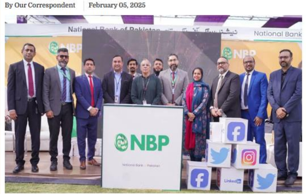
Participants pose for a group photo during the Annual Career Fair 2025, organised by the IBA Career Development Centre (IBA-CDC), at the IBA Main Campus on February 4, 2025.

The IBA Karachi hosted its Annual Career Fair 2025, organized by the IBA Career Development Centre (IBA-CDC), at the IBA Main Campus on Tuesday. This year's theme 'Think Next' captured the bold and innovative spirit of students and the limitless opportunities awaiting them.